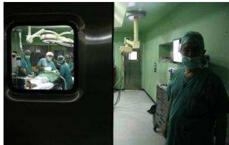
Imagen de archivo de los quirófanos del Hospital de Sant Joan.